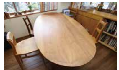
人気の楕円テーブルとイス(クルミ・チェリー・オークなど)