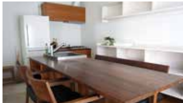
奥にシンクが付いたテーブル兼用キッチン

家具づくりはお客さまの夢をかなえる、お客さまにとっての「自分ブランド」のものづくりと考えるからです。