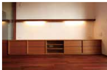
チェリー材のローボード(TV台・オーディオ収納)