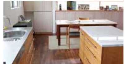
使いやすい並列型キッチン