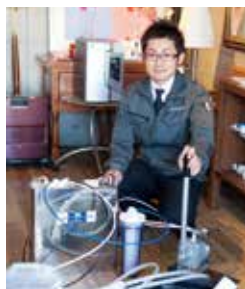
手動ポンプを活用し、衛生的な水が非常時でも確保できるユニット

汚れた水の代わりに市販のお茶を入れて稼働させると、すぐに透明な純水が出てきます。もちろんお茶の香りも味も全くしません。実験ではわかりやすくお茶を使いましたが、実際には有害な不純物や重金属のイオンなども取り除くことができます。