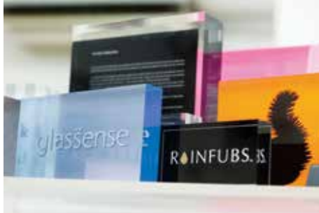
アクリルの透明感を活かしたさまざまな製品