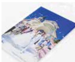
写真が色あせない「fotoryl(フォトルル)」