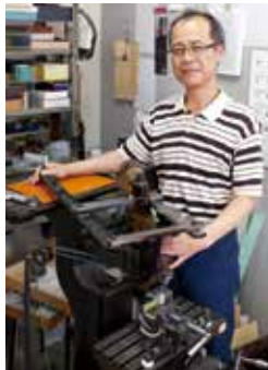
ルーツである機械彫刻機。職人の感性で文字の間隔を調整するところなど、まさにグラフィックデザイナー張りの仕事