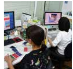
女性の多い職場ではその感性を生かした企画やデザインが意欲的に進められる