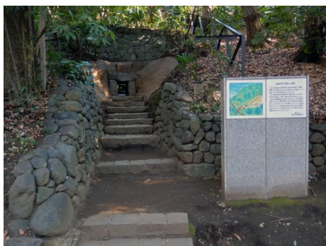
東京都指定史跡 等々力溪谷 3 号横穴