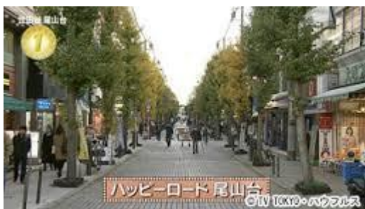
Happy Road 尾山台