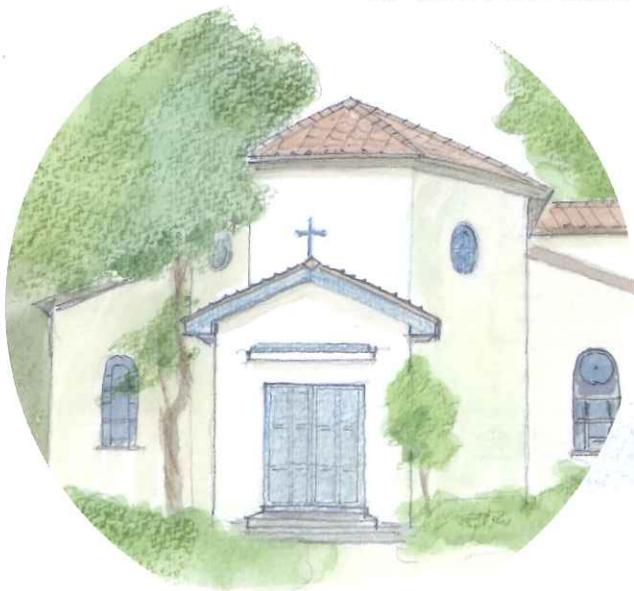
カトリック世田谷教会